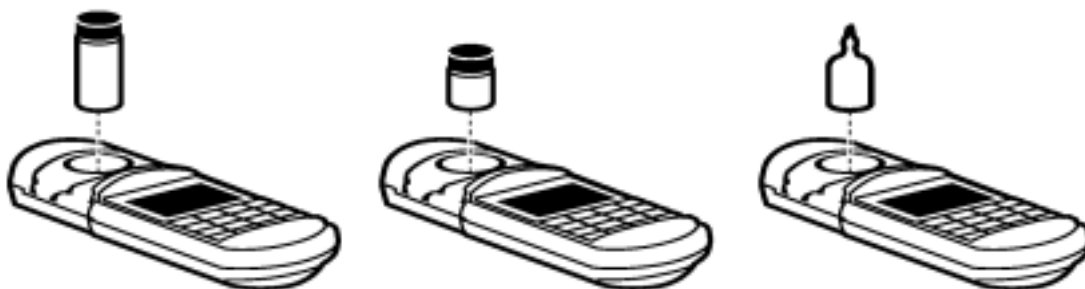
图 5 将样品放入样品池盒中

用不起毛的布或纸巾擦拭样品池,然后将样品池插入样品池盒中,并使菱形标记朝着键盘。